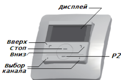
Радиовыключатель 15-канальный DC317