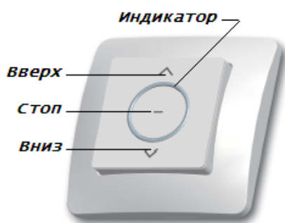
Радиовыключатель 1-канальный DC315